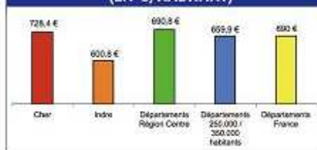
DÉPENSES DE FONCTIONNEMENT (EN €/HABITANT)

les frais de fonctionnement, ce sont plus de 10 % par rapport aux autres départements (soit 20 Millions d'euros de plus par an)